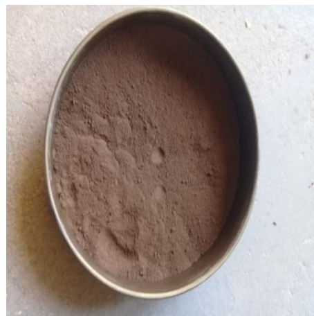
Figura 2- Pó de aciaria elétrica.

Para avaliação do desempenho dos resíduos quando aplicado a materiais cimentícios foi realizado o ensaio de determinação do Índice de Desempenho com Cimento Portland aos 28 dias e calculado através da Equação 1, conforme ABNT NBR 5752: 2014, onde I_c representa o índice de desempenho com cimento aos 28 dias; f_{cb} é a resistência média aos 28 dias dos corpos de prova moldados com cimento Portland e 25 % de resíduo; f_{ca} é a resistência média aos 28 dias dos corpos de prova moldados apenas com cimento Portland.